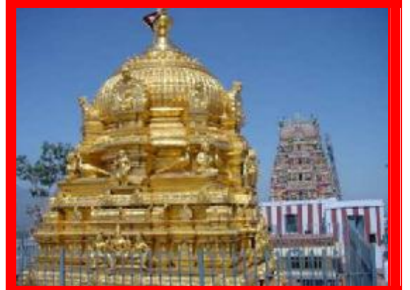
பழனி ஆலய இராஜ கோபுரத்தின் தோற்றம்

கற்பாறைகளில் செதுக்கப்பட்ட சிலைகளைக் கூட ஒரு சில ஆலயங்கள் பழுது பார்க்கப்பட்ட பொழுது தற்காலிகமாக அதே ஆலயத்திற்குள்ளேயே எங்காவது ஒரு இடத்தில் கொண்டு போய் வைத்திருந்து, ஆலய வேலைகள் முடிந்த பின் அதே சிலையை அஷ்டபந்தனம் செய்த பின்னர் ( வெண்ணையில் சில மூலிகைகளைக் கலந்து பசை போல தயாரித்து சில முழுவதற்கும் பூசுவது) முதலில் இருந்த இடத்திலேயே சிலையைக் கொண்டு போய் வைத்து விட்டு அதை பிரதிட்சை செய்து விடுவார்கள் என்பதைத் தவிர, மூலவர் சிலைகளே மாற்றி அமைத்ததாக எந்த ஆலயத்திலும் சரித்திரம் கிடையாது.