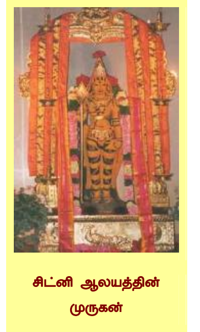
சிட்னி ஆலயத்தின் முருகன்

1985 ஆம் ஆண்டில் சைவ மன்றம் என்ற அமைப்பின் சார்ந்தவர்கள் பத்து வருட காலம் கஷ்டப்பட்டு சிட்னி முருகன் என்ற ஆலயத்தைக் கட்டினர். 1990 ஆம் ஆண்டில் சாலை போக்குவரத்து இலகாவிடம் இருந்தும் இரண்டு தேசிய நெடுஞ்சாலைகளுக்கு இடையே அமைந்து இருந்த ஒரு இடத்தை சைவ மன்றம் விலக்கு வாங்கியது. ஸ்டிராத்தீல்ட் (Strathfield) என்ற இடத்தில் இருந்து பத்து கிலோ தொலைவில் உள்ள மேஸ்மலைப் பகுதி என்ற இடத்தில் உள்ள அந்த இடத்தின் மூன்று பக்கங்களிலிலும் எந்த குடியிருப்புக்களும் கிடையாது.