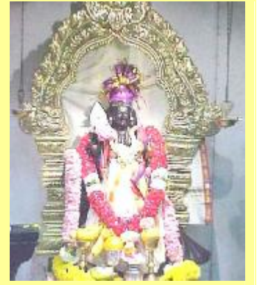
மேற்கு ஆஸ்திரேலியாவில் உள்ள ஆலயத்தில் பால முருகன்