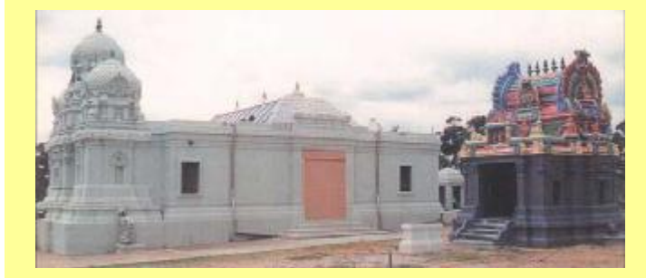
ஸ்ரீ சுப்ரமணிய ஸ்வாமி, ஸ்ரீ வெங்கடேஷ்வரர் ஆலயங்கள்

ஆலயமும் எழுந்தது. அந்த முருகன் ஆலயமே ஆஸ்திரேலியாவில் முதன் முதலாக அகம சாஸ்திர முறைப்படி கட்டப்பட்ட ஆலயம் ஆகும்.