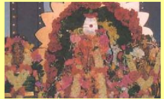
விக்டோரியாவில் உள்ள ஆலயத்தில் முருகன்

ஆரம்பத்தில் அந்த இடத்தை வாங்கிய அமைப்பினர் அங்கு கட்டிடம் கட்டி அதை முருகனுக்கு விழாக்கள், ஆராதனைகள் செய்யவும், கலையரங்கமாகவும் பயன்படுத்தத் திட்டமிட்டு நினைத்தனர். 1994 ஆம் ஆண்டு செப்டம்பர் மாதத்தில் ' முருகன் ஆலயம் மற்றும் தமிழ் கலாச்சார மையத்தை ' சார்ந்தவர்கள் அந்த கட்டிடத்திற்கு அடிக்கல் நாட்டினர். 1997 ஆம் ஆண்டு ஏப்ரல் மாதம் சிட்னியின் மேற்குப்புறத்தில் இருந்த அந்த மேஸ்மீலயில் முருகன் ஆலயக் கட்டிடப் பணி துவங்கியது. நியூ சவுத்வேல்லை சேர்ந்த சைவர்கள் அனைவரும் ஒன்றிணைந்து செயல்பட்டு மாபெரும் அந்த ஆலயத்தைக் கட்டி முடித்தனர்.