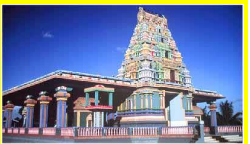
பெரிய கோவில். ஸ்ரீ சிவ சுப்பிரமணிய ஆலயம், நந்தி, பீஜி